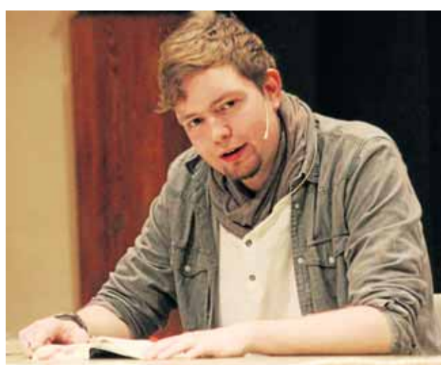
Bastian Bielendorfer hat es nicht leicht: Seine Eltern sind Lehrer. Dieses schwere Schicksal verarbeitet er in zwei Büchern und hat sich damit in den Bestsellerlisten festgebissen.

In der Nacht auf Sonntag haben unbekannte Täter die Doppelgarage auf dem Gelände des Sportparks an der Rennbahn aufgebrochen. Ein Garagentor wurde auf noch nicht bekannte Weise massiv nach innen gedrückt und erheblich beschädigt. Außerdem wurde das Fenster zur zweiten Garage eingeschlagen. Diebesgut wurde vermutlich nicht erlangt. hos